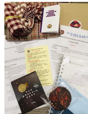
各国のグッズ、土産、資料等