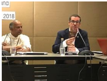
同窓生グッズの検討(ホルト会長)