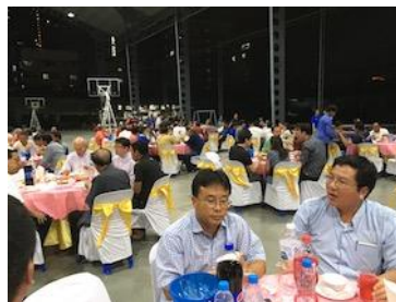
学校での屋外パーティー